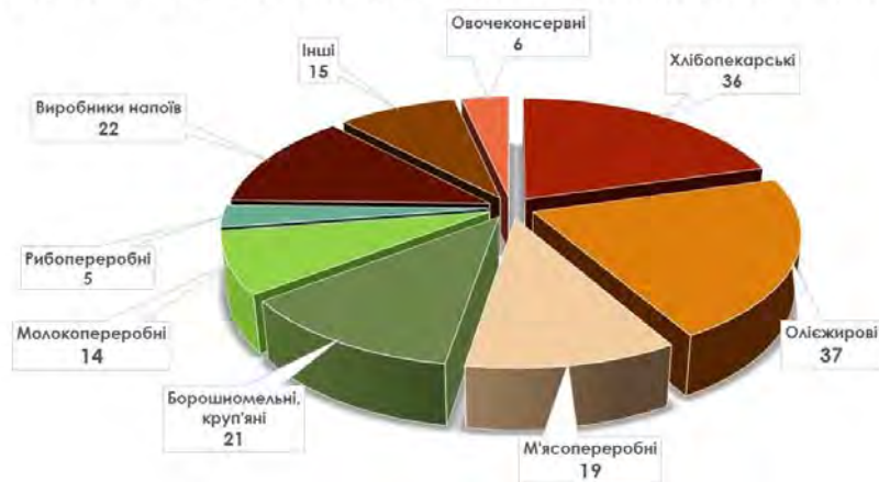
ПІДПРИЄМСТВА ХАРЧОВОЇ ТА ПЕРЕРОБНОЇ ПРОМИСЛОВОСТІ ОБЛАСТІ

Лідерами галузі є такі відомі в Україні підприємства, як ТОВ «Сандора» (виробництво соків, безалкогольних напоїв, снєків, чіпсів), Миколаївське відділення ПрАТ «АБІНБЕВ ЕФЕС Україна» (виробництво пива), ПрАТ «Лакталіс-Миколаїв», ТДВ «Баштанський сирзавод», ПрАТ «Первомайський молочноконсервний комбінат», ПрАТ «Миколаївмолпром» (виробництво молочної продукції), ФГ «Органік Системс» (виробництво томатної пасти), ТОВ «Європейська транспортна стивідорна компанія» (виробництво нерафінованої соняшnikової олії), АТ «Коблево» (виробництво виноградного вина, вермуту).