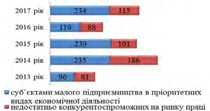
Працевлаштовано на нові робочі місця з компенсацією роботодавцям витрат єдиного внеску (осіб)

які створюють нові робочі місця та працевлаштовують безробітних. Так, за період дії Програми працевлаштовано на нові робочі місця з компенсацією роботодавцям витрат єдиного внеску 1494 безробітних.